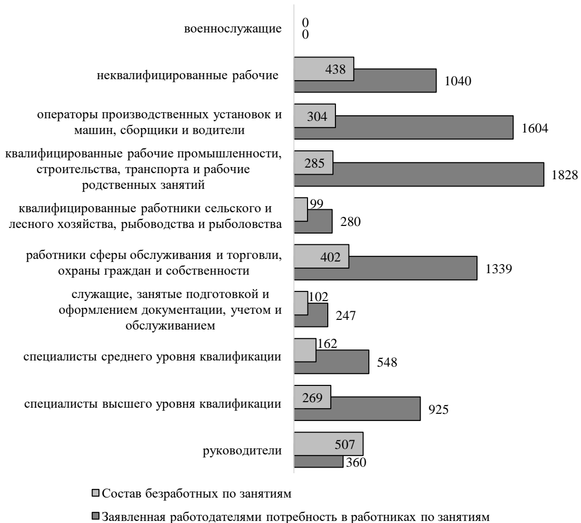
Рисунок 1. Структура спроса и предложения рабочей силы на регистрируемом рынке труда (2022 г.), чел. (составлено автором на основе статистических данных)

Предложение превышает спрос преимущественно в сферах нематериального производства: служащие, занятые подготовкой и оформлением документации, учетом и обслуживанием; специалистов высшего уровня квалификации в области права, гуманитарных областей и культуры; служащие, занятые подготовкой и оформлением документации, учетом и обслуживанием (рис. 1).