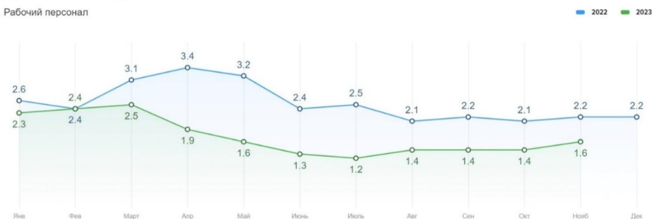
Рисунок 3. Динамика hh. индекса по рабочему персоналу в Республике Мордовия в 2022–2023 гг. (по данным рекрутинговой онлайн-платформы HeadHunter ( hh.ru ))