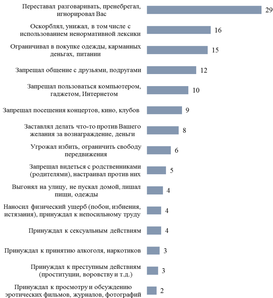
Рисунок 1. Виды и формы супружеского насилия, с которыми сталкивались респонденты, состоящие в браке, за последний год, % (составлено авторами на основе эмпирических материалов)

проявляется прежде всего в ущемлении возможности приобретать одежду, продукты питания и иметь личные текущие расходы (15 %). Физическое (побои, избиения, истязания) и сексуальное насилие распространено между супругами/партнерами в меньшей степени (по 4 % соответственно) (рис. 1).