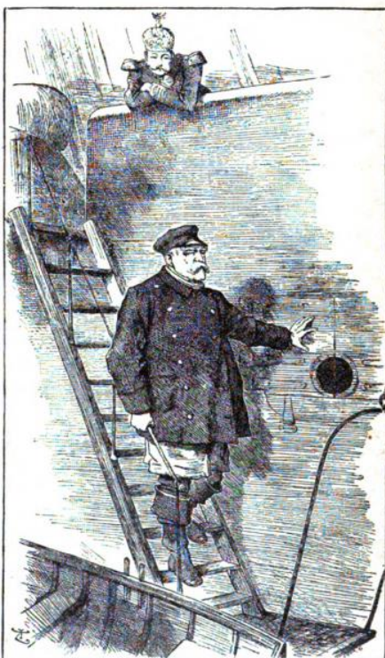
Рисунок 9. Лоцман покидает корабль

Выдающийся российский историк и философ XIX века П.М. Бицилли рассматривал «три волоса на голове Бисмарка» как простейший пример карикатуры, примитивную пародию, когда форма превращается в «кучу приемов» и теряет содержание. Три волоска Бисмарка, по его мнению, «смешат лишь того, для кого Бисмарк конкретный человек, а не представитель германского империализма» [9, с. 451].