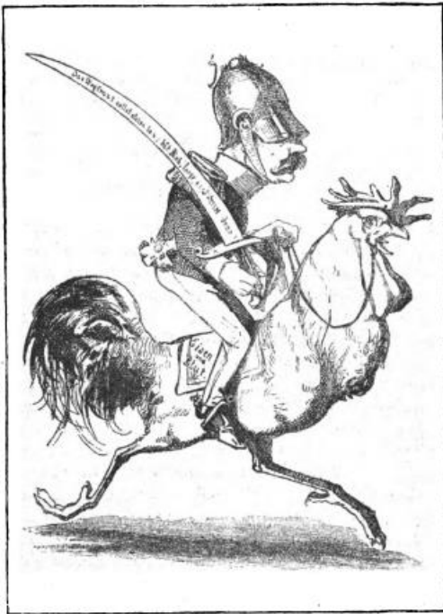
Рисунок 5. Новый Блюхер.

Первый германский рейхсканцлер Отто фон Бисмарк, чья успешная политическая карьера продолжалась почти треть столетия (с 1862 по 1890 гг.), был уже при жизни одним из наиболее любимых персонажей карикатуристов всего мира.