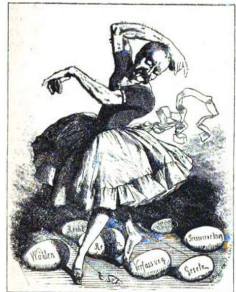
Рисунок 6. Танец на политических яйцах

Это, как поясняется в подписи, «легкая шапочка для праздничных дней» и она «всякому по голове», что можно трактовать как национальное доверие и признание. Карикатура уже, собственно, не нападает на Бисмарка, так как, к удивлению германского общества, этот радикальный «юнкер» явился выразителем немецких идеалов, воплощением немецкой силы и величия [8, с. 217].