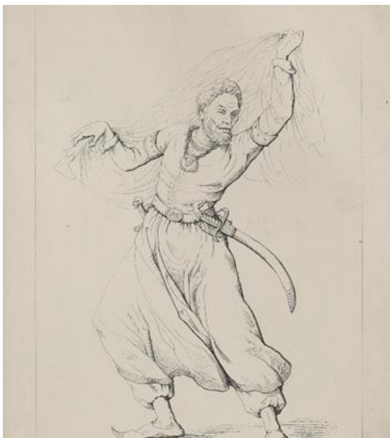
Рисунок 2. Муканна

Одной из самых ядовитых военных сатир Адальберта Волка является карикатура на А. Линкольна «Муканна» (рис. 2). Муканна — это отрицательный персонаж из популярной поэмы Томаса Мура «Лалла Рук»; лжепророк, скрывавший свое уродливое лицо под серебряным покрывалом, якобы иначе люди не смогли бы выдержать его сияния. Американский президент А. Линкольн изображен на данной карикатуре в одеянии восточной танцовщицы с ярко выраженными негроидными чертами и вьющимися волосами. Голова стервятника на ятагане символизирует хищную птицу, питающуюся падалью; а ослиная голова на медальоне вокруг шеи намекает на то, что «танцовщица» не отличается остротой ума [2]. Изображение А. Линкольна в виде изувера и обманщика Муканны было воспринято читателями Адальберта Волка как оскорбление президента США. Они осудили эту карикатуру автора.