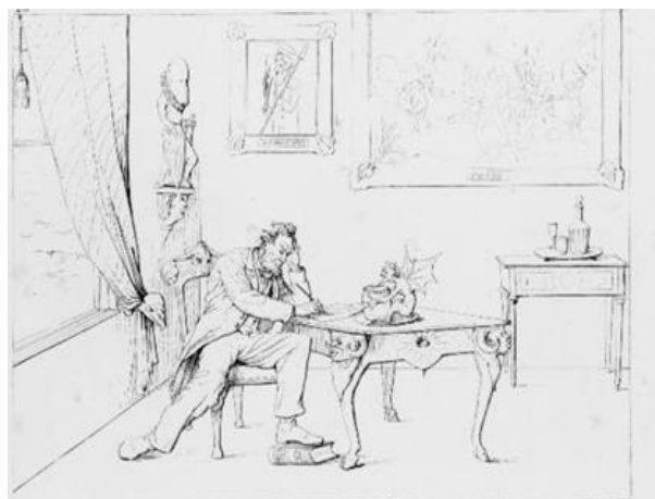
Рисунок 3. Прокламация об освобождении

В карикатурах на А. Линкольна Адальберт Волк также выражал свое отрицательное отношение к отмене рабства и принятии Прокламации об освобождении рабов. На одном из его рисунков (рис. 3) американский президент в окружении чертей подписывает «Прокламацию об освобождении рабов», наступая ногой на американскую Конституцию [3].