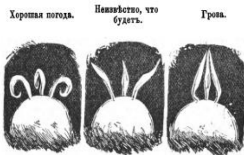
Рисунок 8. Три волоска великого канцлера

Не менее знаменитыми стали и три волоска на голове рейхсканцлера, которые изображались как признак его силы. Они стали таким же популярным атрибутом карикатур на него, как треуголка Наполеона I. В 1881 г. в журнале «Kladderadatsch» был изображен бисмарковский «термометр» (рис. 8). В шутовском пояснении к картинке сообщается следующее: «В «хорошую погоду», в период политического затишья, волоски закручиваются в ту или в другую сторону — все равно в какую. Но вот они становятся вертикально, и положение делается неизвестным, означая возможность каких-то неведомых перемен. Если же они сходятся между собою остриями так, что принимают угрожающее положение меча, верхушки каски, или, если хотите, трех штыков, слившихся в одно острие, то это непременно означает бурю и грозу» [8, с. 231–232].