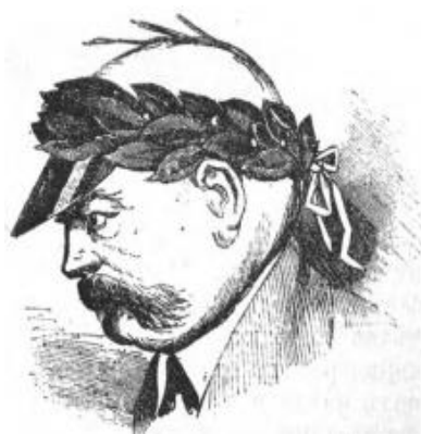
Рисунок 7. Шапочка для праздничных дней

После франко-прусской войны в берлинском сатирическом журнале «Kladderadatsch» появляется виньетка с изображением головы Бисмарка в венке (рис. 7).