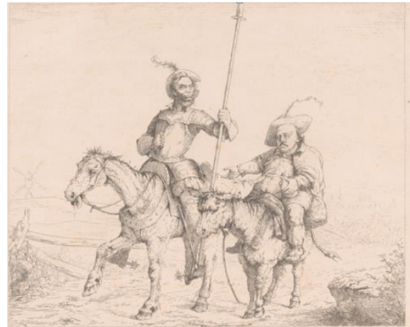
Рисунок 1. Дон Кихот

Деятельность А. Линкольна в период военного конфликта получила неоднозначную оценку в американском обществе, поскольку оно разделилось на два лагеря — сторонников и противников президента. Противники А. Линкольна создавали на него множество карикатур. Политический карикатурист Адальберт Волк, известный своей поддержкой Конфедерации во время Гражданской войны, через карикатуры критиковал американского президента. Его даже называют самым известным сторонником Конфедерации в северном мире искусства. Ему принадлежат карикатуры «Проезд через Балтимор» и «Дон Кихот» (рис. 1). На первой карикатуре автор изобразил А. Линкольна трусливым человеком, а сюжетом второй хотел донести до общества мысль о том, что президент действует как человек, оторванный от реальности, т. е. как Дон Кихот. Помимо этого, на карикатуре «Дон Кихот» Адальберт Волк изобразил генерала, участника Гражданской войны Бенджамина Батлера в роли Санчо Панса [1].