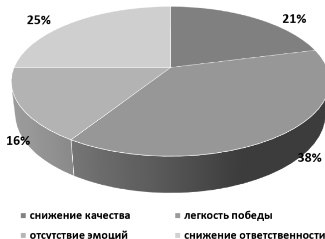
Рисунок 2. Диаграмма рисков при проведении онлайн-конкурсов детских рисунков

Как известно, риски стимулируют дальнейшее развитие процесса, поэтому их фиксация позволяет разрабатывать методы их преодоления. М. Дуглас пишет, что сегодня понятие риска превратилось в культурную конструкцию, расположенную между «личным, субъективным мнением и общественной материальной наукой». Сегодня ученые говорят не о возможности возникновения рисков, а о разработке механизмов борьбы с рисками во всех областях человеческой деятельности, в том числе и в педагогике. Педагогическая рискология стала естественным компонентом современного учебно-воспитательного процесса [7]. Специфика педагогического риска заключается в следующих факторах: ответственности педагога при осуществлении его профессиональной деятельности перед обучающимися; деятельности, направленной на преодоление неопределенности в ситуации принятия решения; регулировании взаимоотношений между участниками образовательного процесса; согласованности действий всех участников процесса [8].