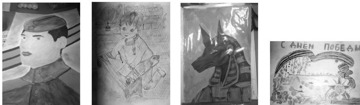
1 2 3 4 Рисунок 3. Рисунки, присланные на онлайн-конкурс

В результате в глаза бросается не качество выполненной творческой работы, а непрофессионализм тех, кто эту работу записал на электронный носитель: недостаточное разрешение сканера, неправильная экспозиция фотоаппарата или видеокамеры, как следствие – недостаток или излишек яркости, резкости, цифровой шум и многое другое. Зачастую ученические работы снимаются на телефон, так как современная техника предоставляет возможность делать это просто и быстро.