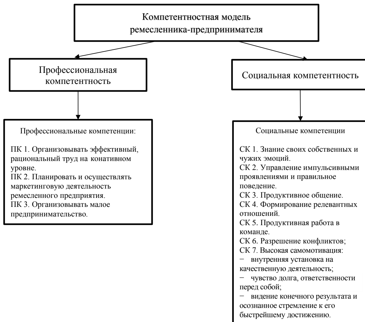
Рисунок 2. Компетентностная модель ремесленника-предпринимателя

С учетом всего вышеизложенного синтезируем компетентностную модель ремесленника-предпринимателя (рис. 2).