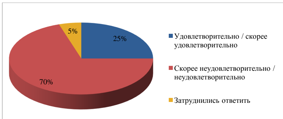
Рисунок 4. Показатели удовлетворённости жителей Азовского района качеством услуг в сфере ЖКХ, в %

Также была поставлена задача выявить удовлетворенность населения в сфере жилищно-коммунального хозяйства. Оценка жителями Азовского района качества услуг по данному направлению представлена на рисунке 4. Подавляющее большинство опрошенных (70 %) не удовлетворены качеством предоставляемых жилищно-коммунальных услуг, удовлетворена лишь четверть опрошенных (25 %), что интересно — 5 % респондентов затруднились ответить.