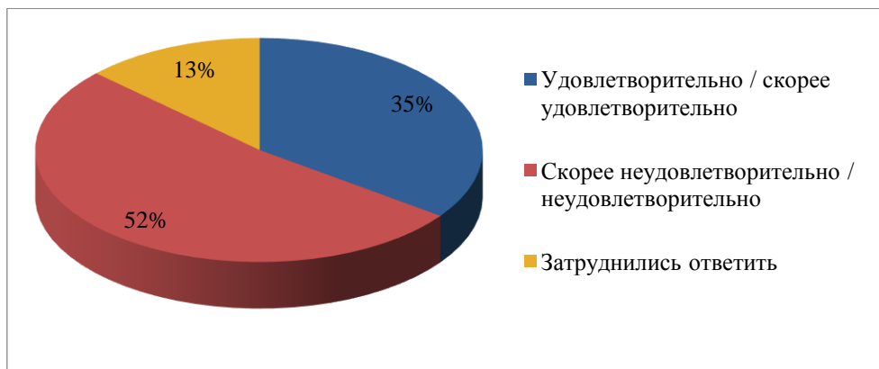
Рисунок 2. Показатели удовлетворённости жителей Азовского района качеством медицинского обслуживания, в %

Оценка жителями Азовского района качества медицинской помощи представлена на рисунке 2. Более половины опрошенных (52 %) не удовлетворены качеством медицинского обслуживания, удовлетворены лишь 35 %, затруднились ответить — 13 %.