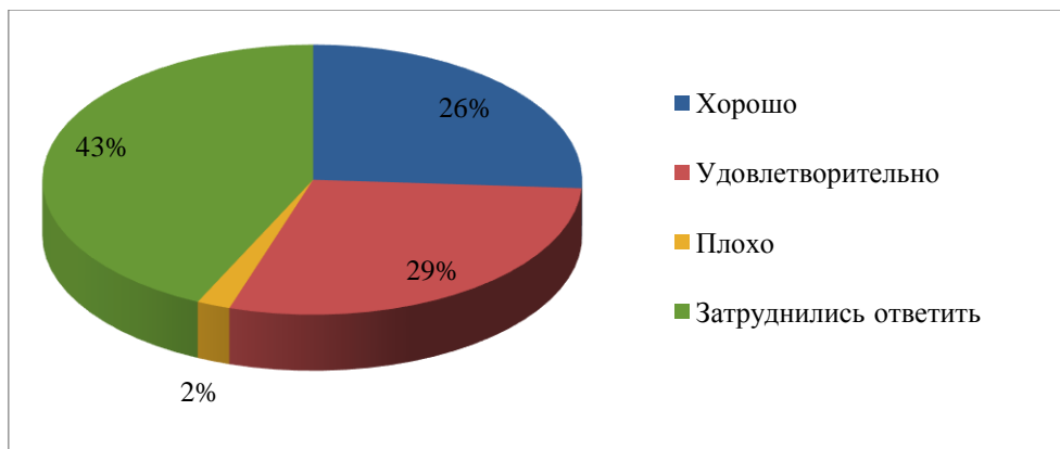
Рисунок 3. Показатели удовлетворённости жителей Азовского района качеством общего образования, в %

Мотивацией хороших и удовлетворительных оценок послужили качественное предоставление образовательных услуг, хорошее состояние материально-технической базы школ (оборудование, ремонт, питание, учебники), высокий уровень профессионализма и компетентности педагогов, высокий уровень подготовки к поступлению в высшие учебные заведения, наличие дополнительных развивающих кружков, секций, мероприятий. Проведенный анализ показал, что неудовлетворительные оценки были мотивированы недовольством образованием в целом: реформами в сфере образования, программами обучения, загруженностью детей, разобщенностью образовательных программ.