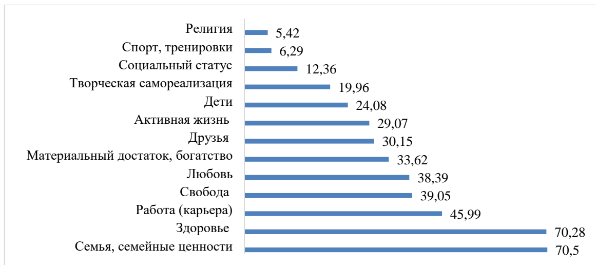
Рисунок 1. Ценности молодежи (в % от количества респондентов) (составлено автором)

В рамках исследования респонденты выбирали ключевые для себя ценности. Большинство молодых людей выбрали семью и семейные ценности (70,5 %), на втором месте психическое и физическое здоровье (70,28 %) (рис. 1).