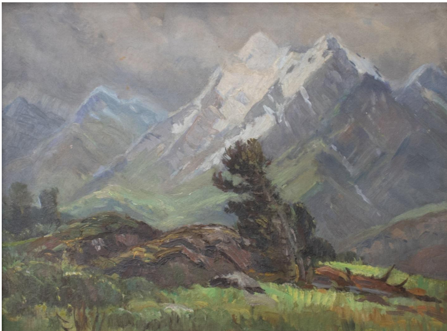
Рисунок 2. Д.И. Кузнецов. «Вершины Алтая». 1946. Картон, масло. 35×47. Бийский краеведческий музей имени В.В. Бианки