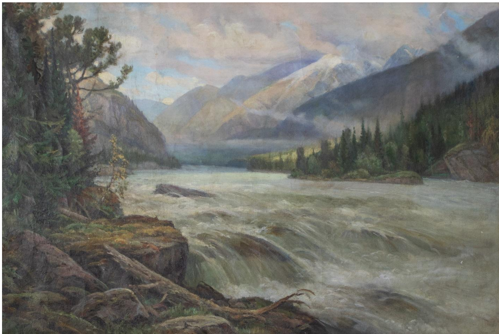
Рисунок 5. Д.И. Кузнецов. «Катунь в верховьях». 1956. Холст, масло. 85×125. Бийский краеведческий музей имени В.В. Бианки