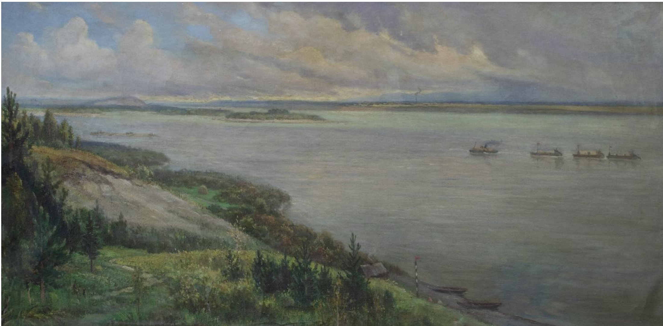
Рисунок 7. Д.И. Кузнецов. «Рождение Оби». 1951. Холст, масло. 85×170. Бийский краеведческий музей имени В.В. Бианки (фото автора: Т.П. Алексеевой)