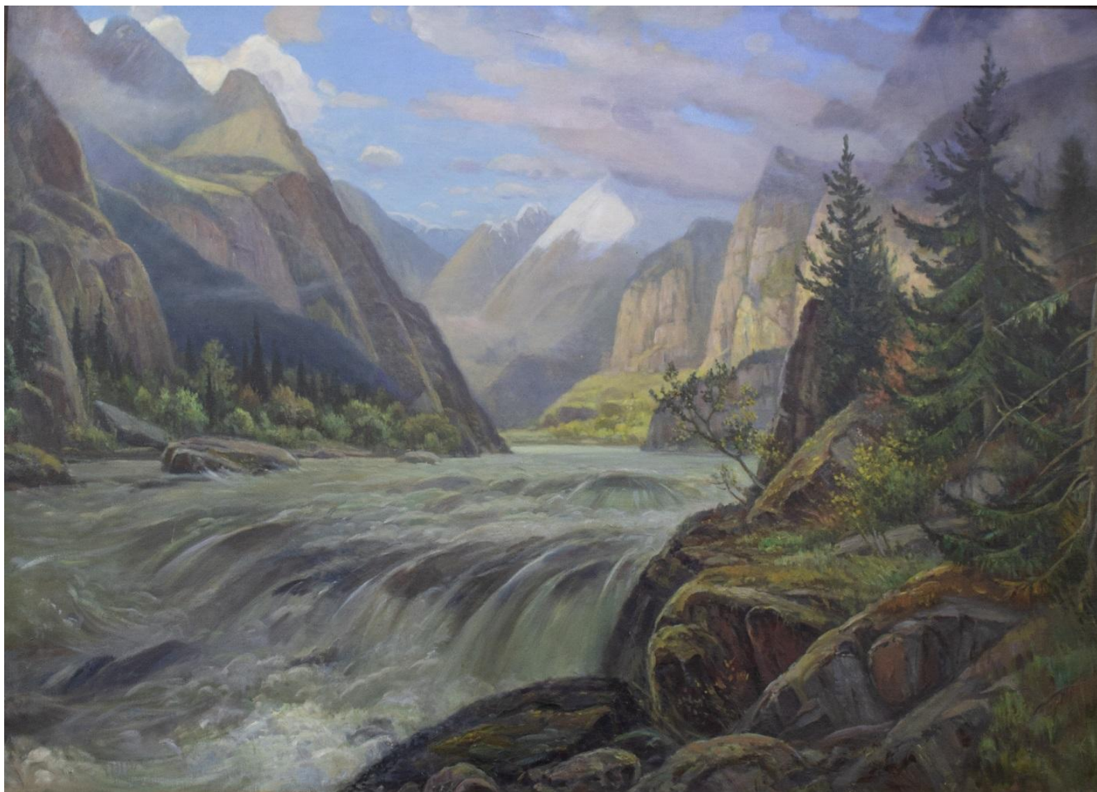
Рисунок 6. Д.И. Кузнецов. «Река Актру». 1961. Холст, масло. 91×62. Бийский краеведческий музей имени В.В. Бианки