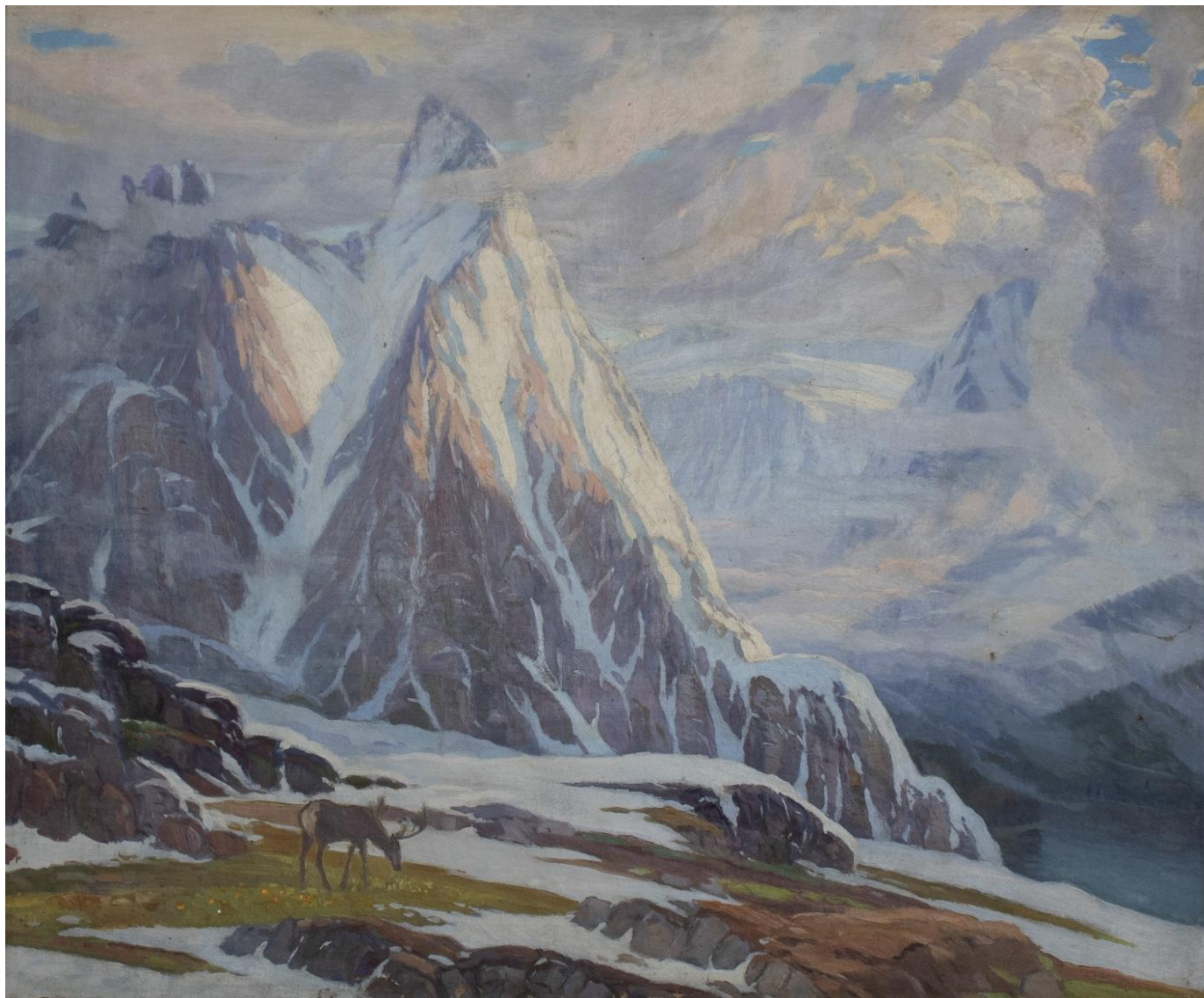
Рисунок 3. Д.И. Кузнецов. «Вершины Алтая». 1950. Холст, масло. 85×104. Бийский краеведческий музей имени В.В. Бианки