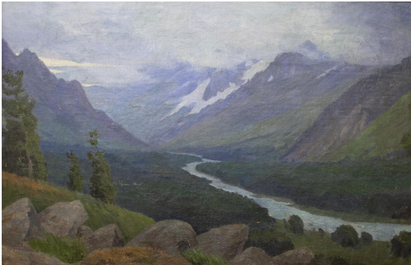
Рисунок 1. Д.И. Кузнецов. «Алтай хмурится». 1912. Холст, масло. 86,5×133. Бийский краеведческий музей имени В.В. Бианки