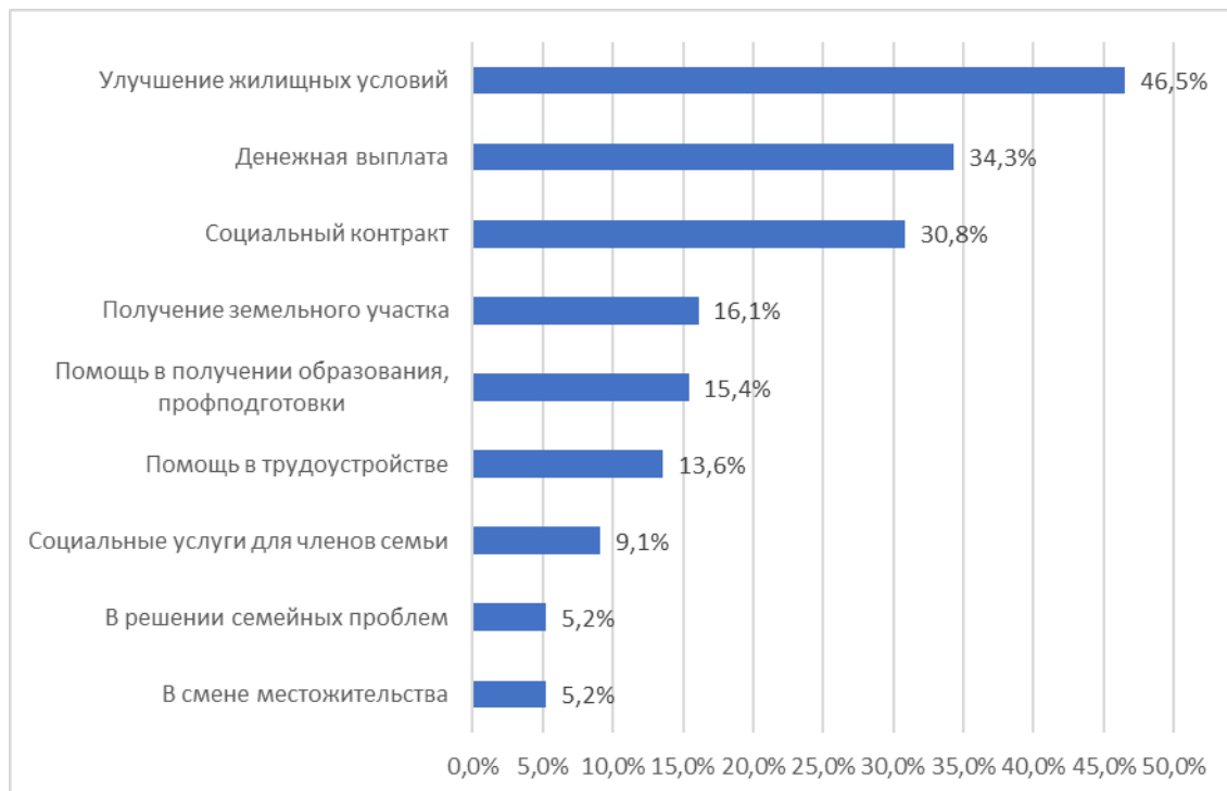
Рисунок 3. Распределение ответов на вопрос «В какой помощи Вы нуждаетесь?» (составлено автором на основе эмпирических материалов)

15,4 %. Для определения потребностей респондентов в конкретных формах социальной помощи в анкету был включен вопрос «В какой помощи Вы нуждаетесь?». Результаты распределения ответов респондентов показали, что 46,5 % опрошенных нуждались в улучшении жилищных условий, 34,3 % — в денежных выплатах, 30,8 % хотели бы получить социальный контракт, 16,1 % нуждались в земельном участке, 15,4 % — в получении образования, профподготовки, 13,6 % испытывали необходимость в получении помощи в трудоустройстве, 9,1 % нуждались в социальных услугах для членов семьи, 5,2 % нуждались в решении семейных проблем, 5,2 % хотели бы получить помощь для смены места жительства (рис. 3).