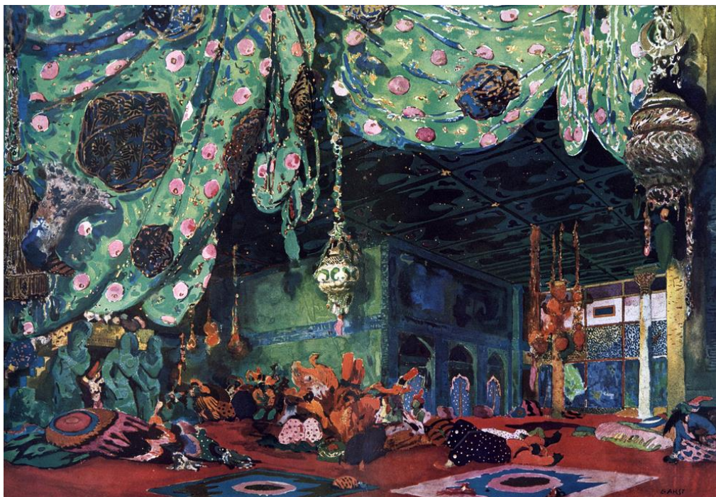
Рисунок 2. Л. Бакст. Декорации к балету «Шахерезада» на музыку Римского-Корсакова. 1910