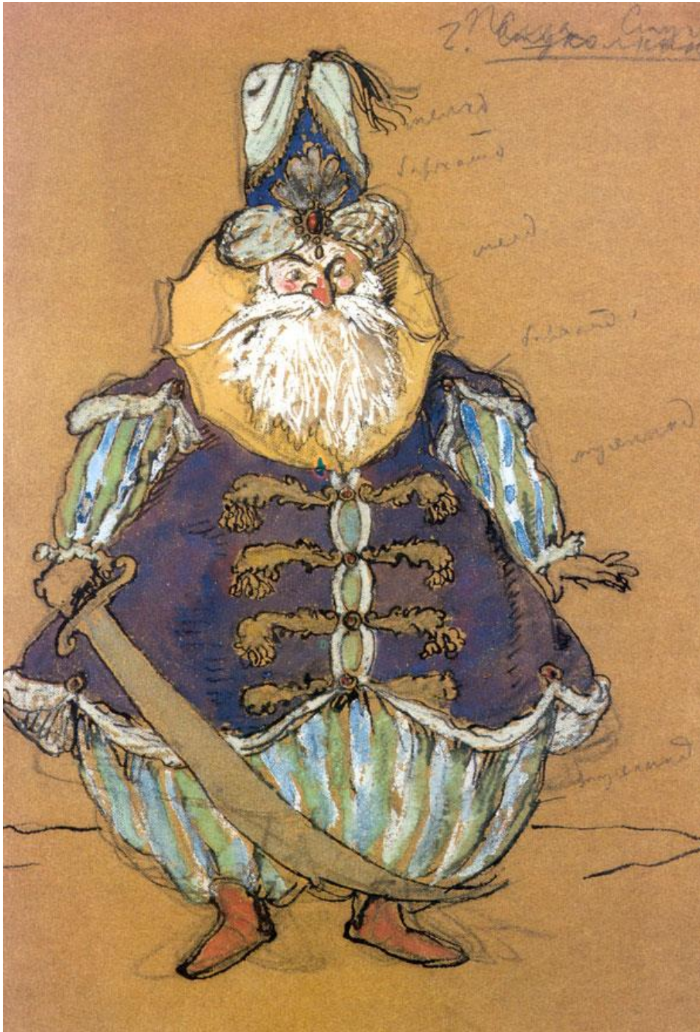
Рисунок 1. А. Бенуа. Эскиз костюма Паши к балету «Павильон Армиды». 1907 (источник http://benua.su/sketch_1 )

способствовали успеху проекта. Он умел собрать и организовать большое количество творчески одаренных людей в одном проекте. В его проектах были задействованы лучшие артисты (Т. Карсавина, А. Павлова, В. Нижинский, А. Больш и многие другие), композиторы (Н. Черепнин, И. Стравинский, М. Глинка, С. Прокофьев, Н. Римский-Корсаков) и мастера хореографии (М. Фокин, В. Нижинский, Дж. Баланчин, Л. Мясин, Б. Нижинская и другие), талантливые художники (А. Бенуа, Л. Бакст, М. Добужинский, Н. Рерих, Н. Гончарова, М. Ларионов и другие).