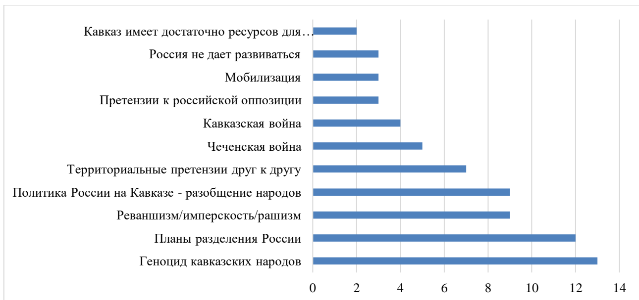
Рисунок 4. Посты канала по тематике содержания (составлено авторами на материалах анализа)

Единственное национальное территориальное образование — Ногайский район в Карачаево-Черкесии, площадью 187 кв. км. Совсем не много для тех, чьи предки господствовали на просторах от Волги до Иртыша, от Урала до Каспия...»