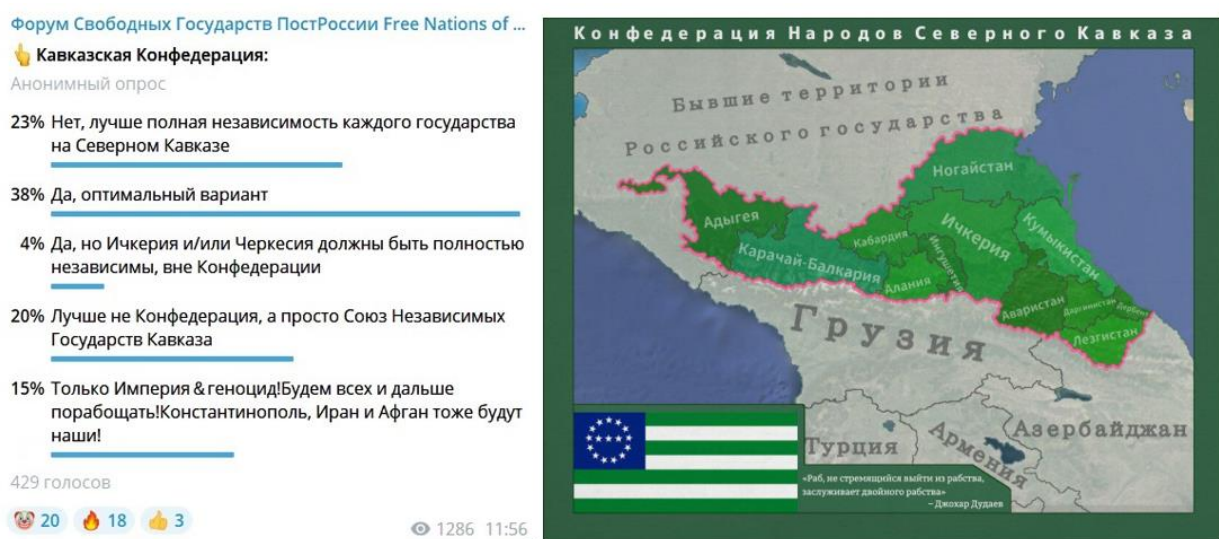
Рисунок 5. Один из предложенных вариантов разделения Северного Кавказа (взято из публикаций в Telegram-канале «Форум Свободных Государств ПостРоссии»)

«Свободные и независимые Ичкерия и Дагестан, а также Кавказская (Кон)Федерация со столицей во Владикавказе: удачная ли такая визия для Северного Кавказа?» (рис. 5).