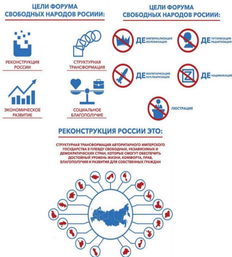
Рисунок 1. Заявленные цели «форума свободных народов»

Более официальным началом нынешней версии проекта «деколонизации России» можно считать 23 июня 2022 г., когда Комиссия США по безопасности и сотрудничеству в Европе («Хельсинская комиссия») провела брифинг, названный «Декolonизация России: моральный и стратегический императив». Участники этого мероприятия призывали оказывать поддержку сепаратистским движениям внутри России и в зарубежных диаспорах. 9 В ходе брифинга деколонизация России и ее распад на 17 частей были обозначены как стратегическая цель США [7, с. 23]. Через месяц 23–24 июля в Праге был проведен второй форум, в котором «приняли участие представители российской несистемной оппозиции, а также некоторых националистических организаций (например, бурятских, ичкерийских и пр.)» [8, с. 137]. На этом форуме была озвучена концепция проекта деколонизации России (рис. 1).