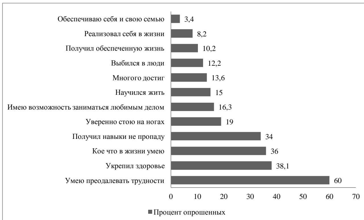
Рисунок 2. Результаты профессиональной жизни в спорте по оценкам спортсменов (составлено автором)

Профессиональные спортсмены однозначно высоко оценивают значимость спорта как института становления личности, причем с каждым годом все выше. Профессиональный спорт институционализируется и стабилизируется, как сфера жизнедеятельности, предоставляя спортсмену все больше социальных возможностей и гарантий. Так, практически все респонденты, независимо от пола, возраста, вида спорта и уровня профессиональной квалификации признают, что тот опыт и знания, которые они приобрели благодаря занятиям спорта, помогают им реализовываться в других сферах жизни. На рисунке 2 отмечены результаты профессиональной жизни в спорте по оценкам спортсменов, принявших участие в опросе.