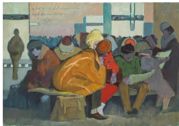
Рисунок 5. Краевская Е. Железнодорожная станция Средместье. 1967 г. (источник https://artinfo.pl/dzielo/dworzec-srodmiescie-1967-r )

Пассажирский вагон, который становится своеобразным домом для пассажира на время его путешествия, так же неоднократно привлекал внимание западных живописцев. При этом мастера XIX в. ярко показывали разницу между условиями путешествия представителей разных сословий. Представители высшего класса получали максимальный комфорт в