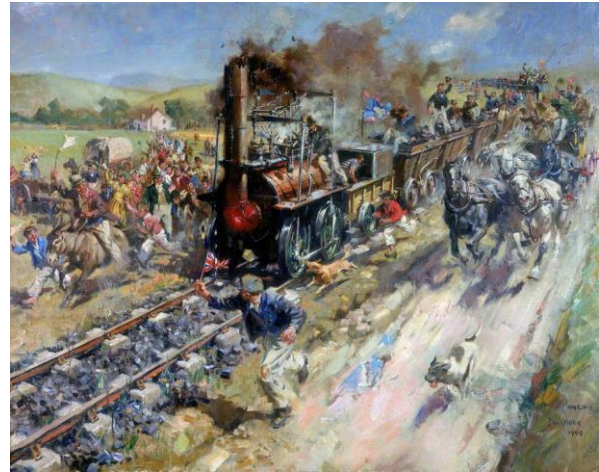
Рисунок 2. Кунео Т.

Однако технический прогресс оборачивается и другой стороной — техника вообще, а железная дорога в частности, имеет и разрушительный потенциал. Дискуссии об отрицательном воздействии железной дороги на окружающий мир, на человека велись в обществе и нашли свое отражение в разных видах искусства. Об этом пишет Г.Ю. Филипповский, анализируя английскую и русскую поэзию XIX в.: «у всех отмеченных авторов — те же тайные страхи и опасения, те же ужасные предчувствия издержек технического прогресса в его неуклонном и динамическом развитии, — опасения страшного вызова, который бросает прогресс цивилизации исконной природе мира и человека» [11, с. 12]. В живописи данная идея находит мощное воплощение в центральной части триптиха Дж. Мартина «Страшный суд» (1851–1853 гг.). На полотне человечество разделено на две части — «спасенные» собираются по правую руку от Бога, среди них есть известные и узнаваемые личности, «проклятые» изображены с противоположной стороны. Их разделяет зияющая пропасть, в которую проваливается железнодорожный состав. Колористически яркое,