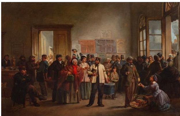
Рисунок 4. Брос Я. Зал ожидания железнодорожного вокзала. 1866 г. (источник https://www.mutualart.com/Artwork/The-waiting-room-at-the-train-station/C88C4BEEAFB5B1E1 )

Постепенно общество осваивает новый способ передвижения, железная дорога становится всё более привычной, залы ожидания постепенно наполняются спокойствием, а в XX в. — ощущением рутинности, бесконечно тянущего времени и даже тоски. Герои работы Е. Краевской «Железнодорожная станция Средместье» (1967 г., рис. 5) безлики и серы, несмотря на несколько цветных фигур на первом плане. Они дремлют, сидя в неудобных позах, пытаются беседовать или читать газеты, стараясь хотя бы чем-то заполнить время томительного ожидания поезда.