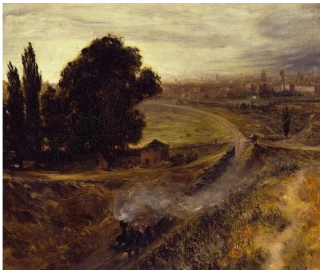
Рисунок 1. Менцель А.