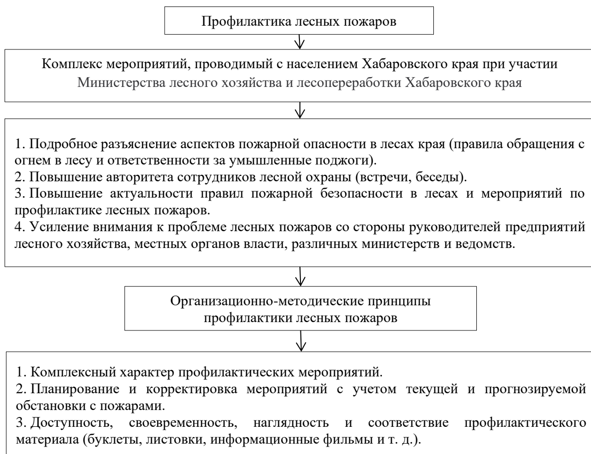
Рисунок 1. Комплекс мероприятий, проводимый с населением Хабаровского края по профилактике лесных пожаров (составлено автором)

предупреждению возникновения пожаров сотрудниками надзорной деятельности проводятся рейды по садоводческим товариществам, дачным участкам и частному сектору.