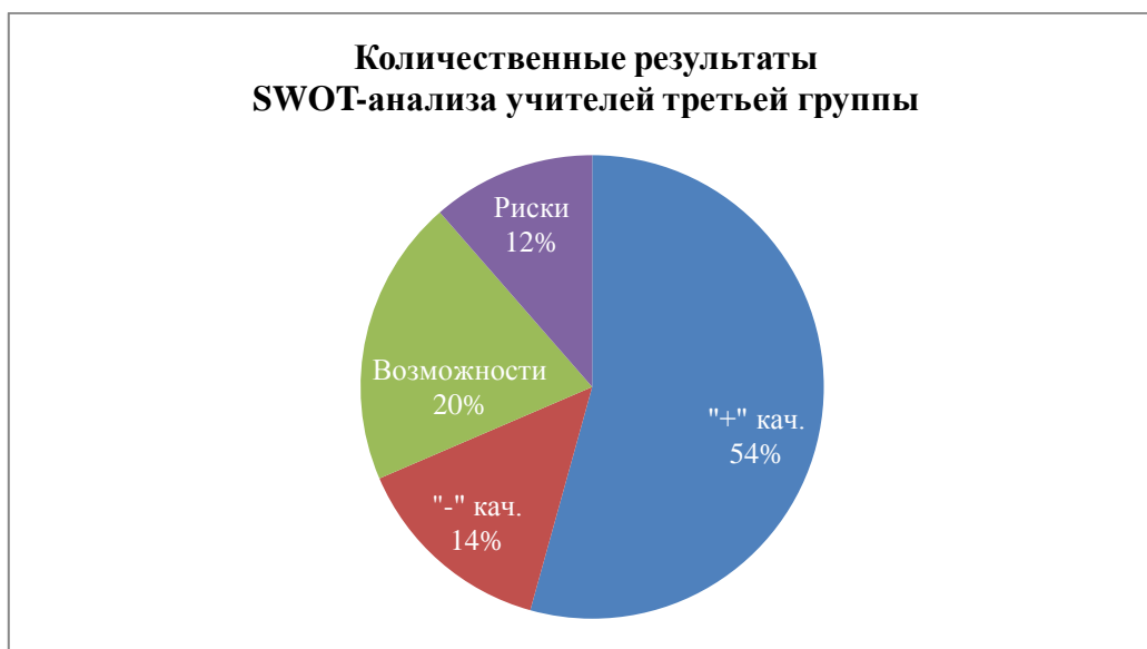
Рисунок 3. Результаты качественно-количественного анализа

переходят в «возможности». Но качество заявленных возможностей уже другое: «Быть реализатором идеи», «Инициатор», «Иметь много работ и быть востребованным», «Написать сценарий», «Организовать детей и коллектив», «Мотивировать», «Поддерживать», «Вдохновлять». Если сравним содержание с первой группой, где возможности связаны только с личной деятельностью, во второй группе возможности обозначаются и в социально-преобразовательной деятельности: «Мотивировать», «Помогать», «Вдохновлять» и пр. Появляется личностная уверенность и лидерство. Если у первой группы отрицательные качества на 100 % были внешними, то во второй группе эти качества внешние на 10 %, а на 90 % связаны с «Я-профессиональным»: «Лень», «Упрямство», «Откладывать на потом», «Ранимость», «Импульсивность», «Непонимание», «Эмоциональное выгорание», «Низкое финансовое стимулирование». В категории «риски» ситуация стала более конкретной: «Выгорание», «Срыв», «Короткие сроки», «Материальная база слабая», «Физическая и психическая усталость могут сказаться на качестве». В данной группе есть стратегические линии внешнего и внутреннего развития, но угрозы и риски не контролируемы и сопровождаются страхом потому, что реальные угрозы связаны с отрицательными качествами так и не осознаются (рис. 2).