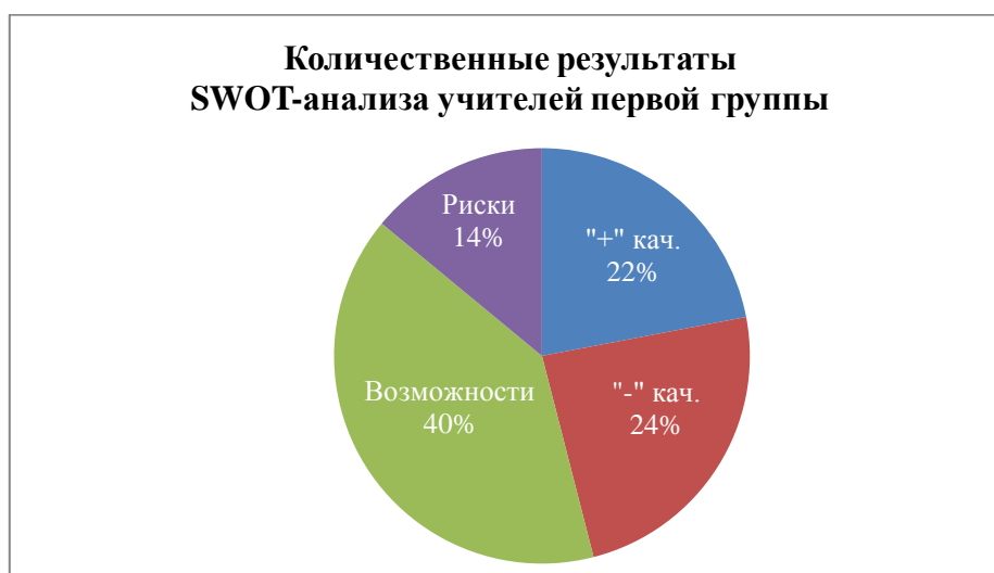
Рисунок 1. Результаты качественно-количественного анализа

В процессе качественно-количественного анализа были получены результаты, которые мы описываем ниже.