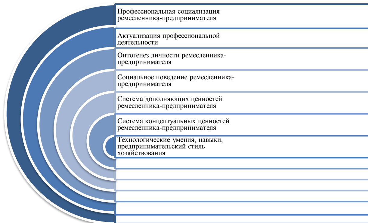
Рисунок 2. Процесс социогенетического развития современного ремесленника-предпринимателя

Изложенная в рисунке логика социогенетического развития современного ремесленника-предпринимателя, позволяет решить проблему осуществимости процесса профессиональной социализации в педагогической действительности субъекта образования. Для этого потребовалась адекватная интерпретация данной теории, в виде концепта и онтологического обоснования преобразований в системе профессиональной подготовки ремесленников-предпринимателей.