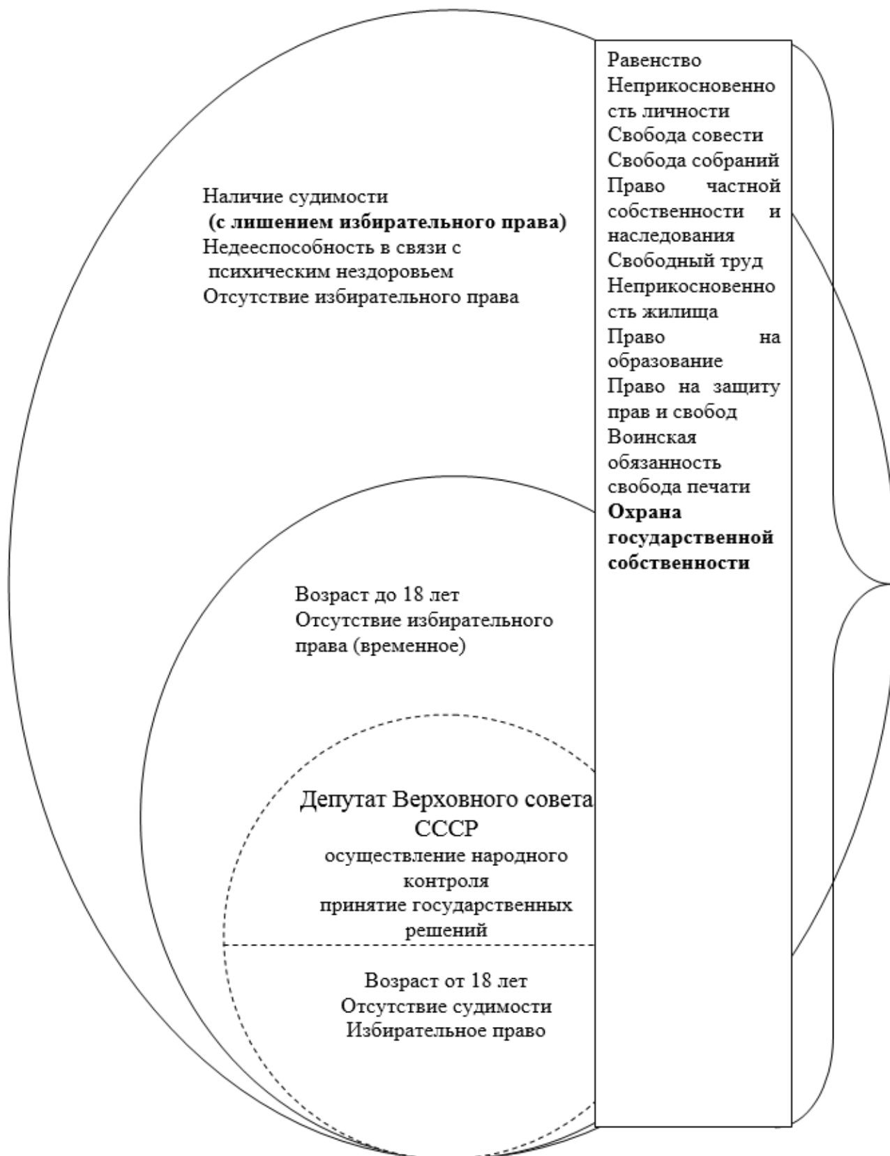
Рисунок 3. Прототипическая структура интертекстуального концепта граждан в Конституции РСФСР 1936 г.

Таким образом, сравнение структуры специального концепта гражданин в интертексте Конституции России позволяет наблюдать качественное изменение исследуемого объекта. Анализ показал, что данный интертекстуальный концепт не является константным, а меняет